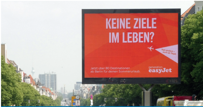
Public eye-catcher on the streets